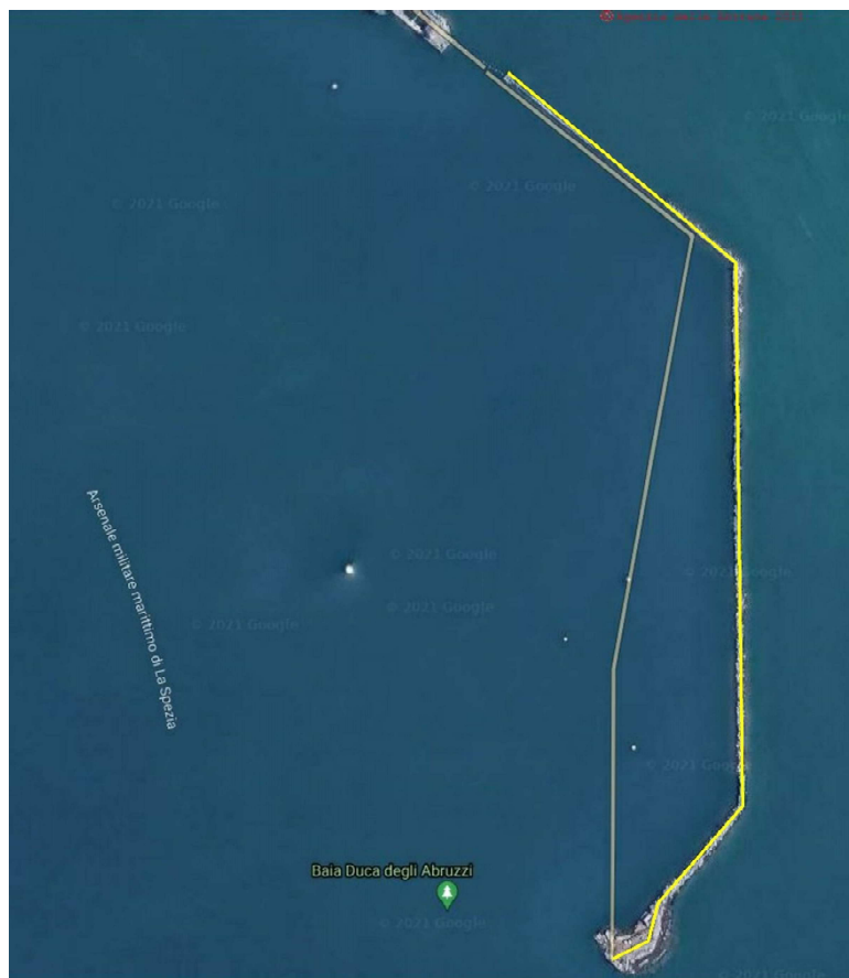
Fig. 3 – Evidenziata in giallo il reale sviluppo delle ostruzioni della Darsena Duca degli Abruzzi lato “nord” e lato “est”.